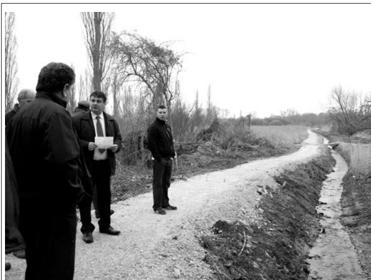
Az önkormányzat egy sétánnyal köti össze a 71-es főutat és a kerékpárutat a Szent János forrásnál, a Malom-árok mentén. A kép az idegenforgalmi bizottság bejárásán készült.