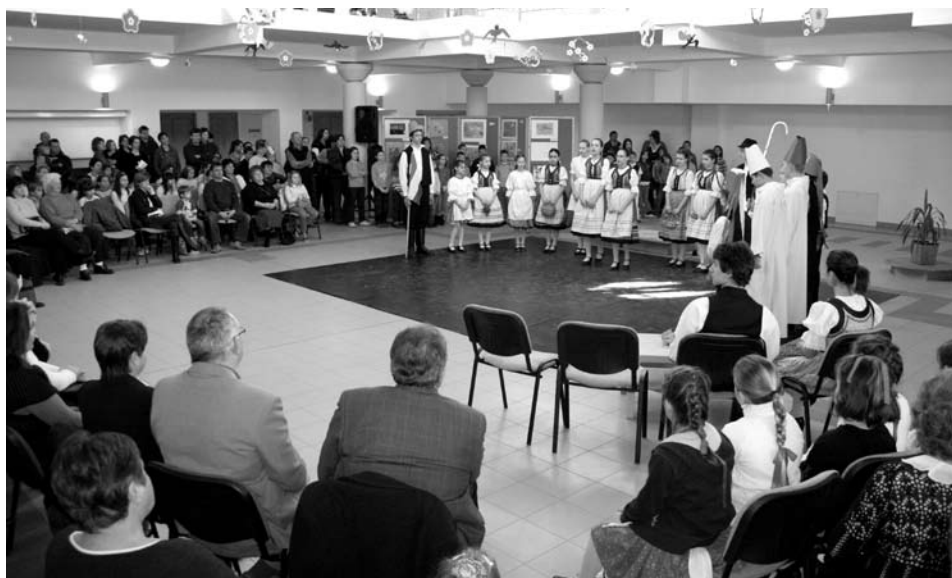
Gergely-járás felelevenítése a fesztivál megnyitóján