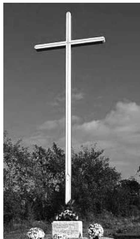
Képünk a fertőszentmiklósi – ugyanilyen – fénykeresztet ábrázolja

Weitere: www.datec.ro/fatima www.fatima.ch