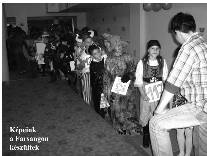
Képeink a Farsangon készültek