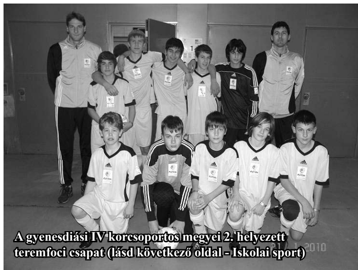
A gyenesdiási IV korcsoportos megyei 2. helyezett teremfoci csapat (lásd következő oldal - Iskolai sport)