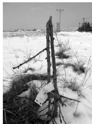
Tavaly több facsometét törtek ki garázdák a Balaton utcában