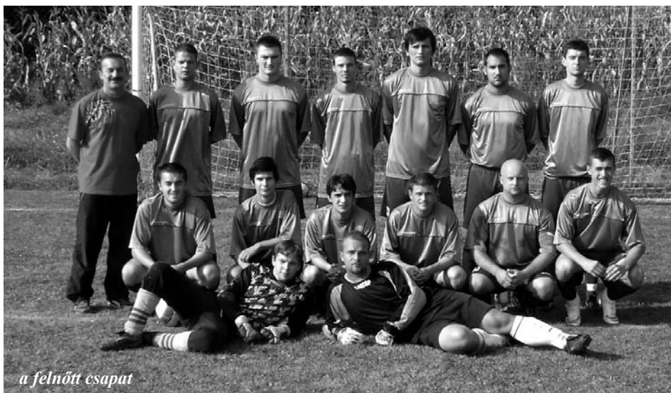
a felnőtt csapat

Tájékoztatjuk a gyenesdiási horgász-egyesület tagjait, hogy kedvezményes árú (akciós) területi jegyek kaphatók a Klubkönyvtárban, január első hetében (január 4-8.), munkanapokon 9-10 óra között.