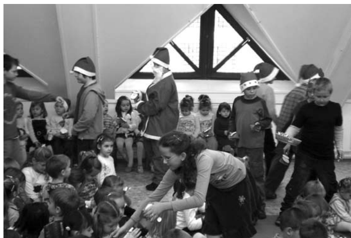
Iskolások Mikulás műsora az óvodában