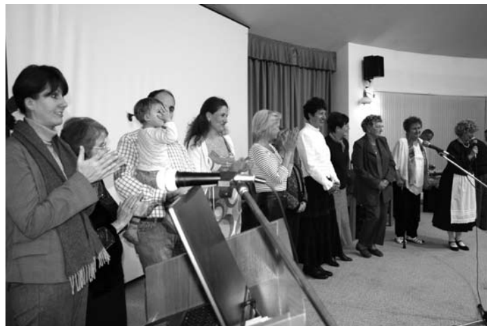
Nagy sikere volt a Forrásvíz Természetbarát Egyesület november 14-i Márton-Napi estjének, különösen a jól elkészített liba ételeknek. Dicséret elkészítőiknek (jobb oldali képen).