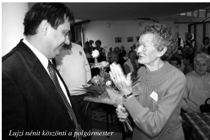
Lujzi nénit köszönti a polgármester