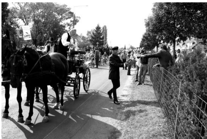
Idén máshogy szerveztük a Szüreti vígasságokat. A menet kicsit hosszabb volt, a körforgalom mellett felállított rendezvénysátorban zajlottak a programok éjjelig (vagy még tovább is)