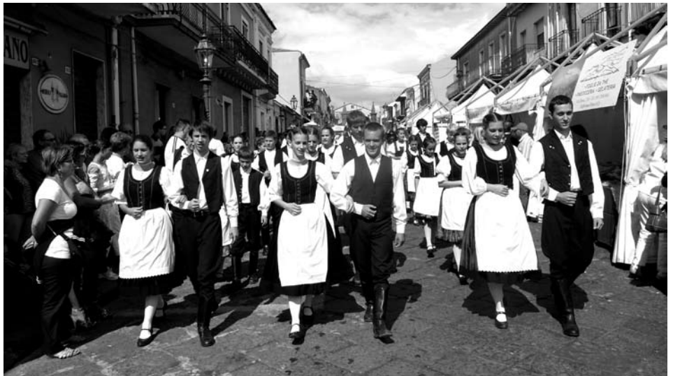
Fesztiváli hangulat Szicíliában