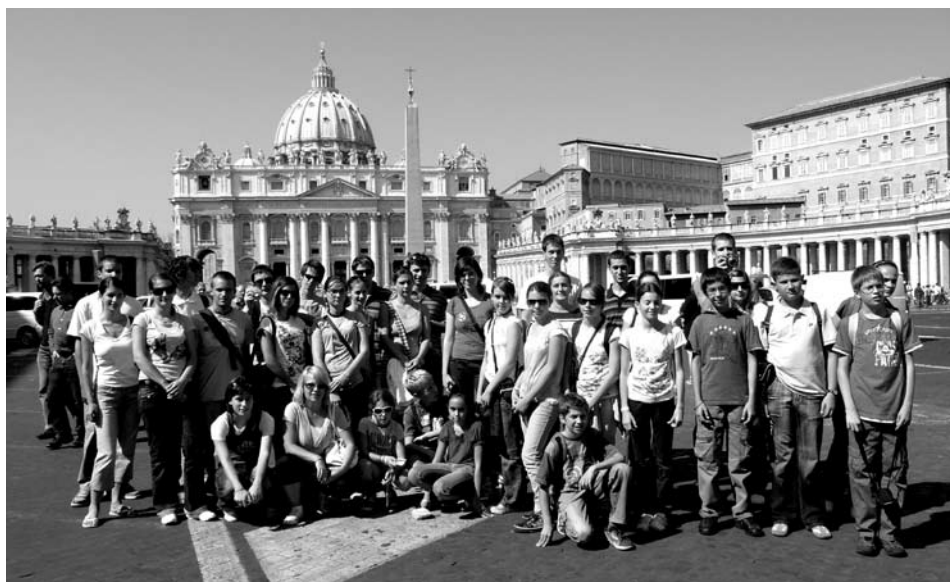
Rómában, a Szent Péter téren

Augusztusban, Gyenesdiáson láttuk vendégül a Szicíliából, Messina városából érkezett „ Canterini Peloritani ” folklór együttest, akik különleges zenéjükkel és táncaikkal lepték meg a helyi és környékbeli közönséget.