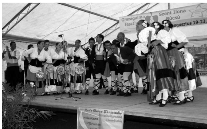
... és a szicíliai folklórcsoport bemutatója egyaránt nagy tapsot kapott

Szombaton a Községháza előtt katonai hagyományörzők díszelgése volt igen látványos program ( címoldali kép ), majd az osztrák és székely testvértelepüléseink és a néptáncsoportunk szicíliai vendégei mutatkoztak be, köszöntötték, köszöntöttük egymást. Délután Boombatucada dobos és a Let's Dance Stúdió hastáncos bemutatója – majd egy gyermekszépségverseny díjkiosztója – után a várva várt folklórbemutatón - a mieink mellett - megcsodálhattuk a vendég települések műsorát. Az osztrákok fúvószenét, a szicíliaiak temperamentumos vegyes műsort mutattak be, a székelyek pedig