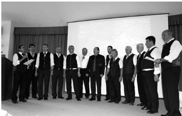
Osztrák férfikórus a Községházán