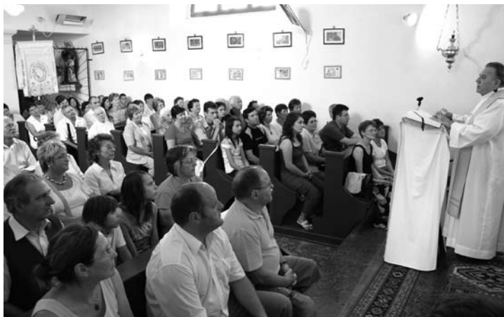
A Szent István napi misén