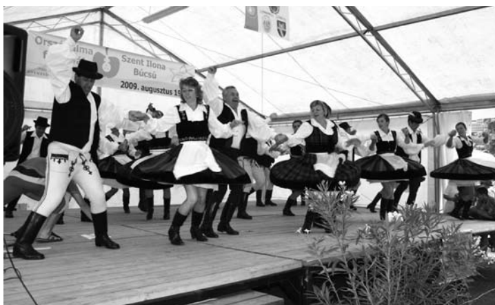
Csíkszenttamásiak lendületes tánca ...