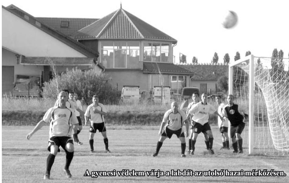
Agyenesi védelem várja a labdát az utolsó hazai mérkőzésen.

szülést a következő bajnoki idényre. Jelenleg még tart az átigazolási időszak és a szövetség később készíti el a bajnokság sorsolását, ami az augusztusi Gyenesdiási Híradóban lesz olvasható.