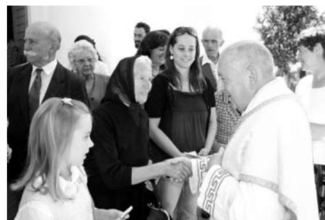
Fogadja a hívők gratulációját