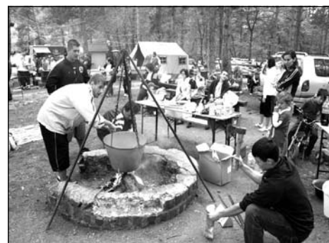
A főzőverseny 23 csapata közül az egyik