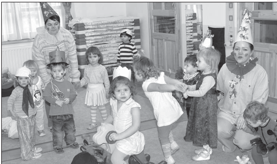
Február 19-én "alakoskodtak", tartották farsangi ünnepüket a bölcsődések és az óvodások

A pályamunkák elején tüntessék fel a mű címét, a pályázó nevét, életkorát, az intézmény és a felkészítő pedagógus nevét. Kérjük kásirozva küldjék el az alkotásokat!