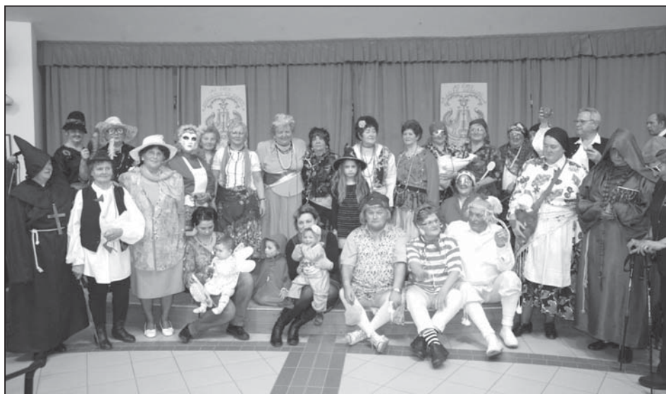
Igen nagy érdeklődés mellett zajlott a hagyományos fánkpárti rendezvényünk, élvezetes műsorok (zalakomári, keszthelyi, csersegtomaji és helyi fellépőkkel) felmezesek, remek fánkok, zene, tánc és jó társaság teremtette meg a kitűnő hangulatot. Képzünk a jelmezbe öltözöttek.