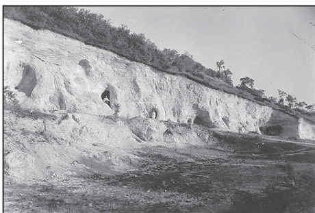
a barlangok a '30-as években ... ... és ma

Gyenesdiás Nagyközség Önkormányzata és a Gyenesdiási Nemesi Erdőbirtokossági Társulat együttműködése folytán elkezdődött a még megmaradt Tücsök-dombi barlangok előtti terület rendbetétele, és a barlangok feltárása. A feltáráson túl az eredeti rendezett állapotot idéző széles parkoló terület és bejárati rész is kialakításra került a Vadánlök felé. A munkálatokhoz az anyagi forrás nagy részét az Önkormányzat biztosította, illetve a téli közmunka program során alkalmazott dolgo-