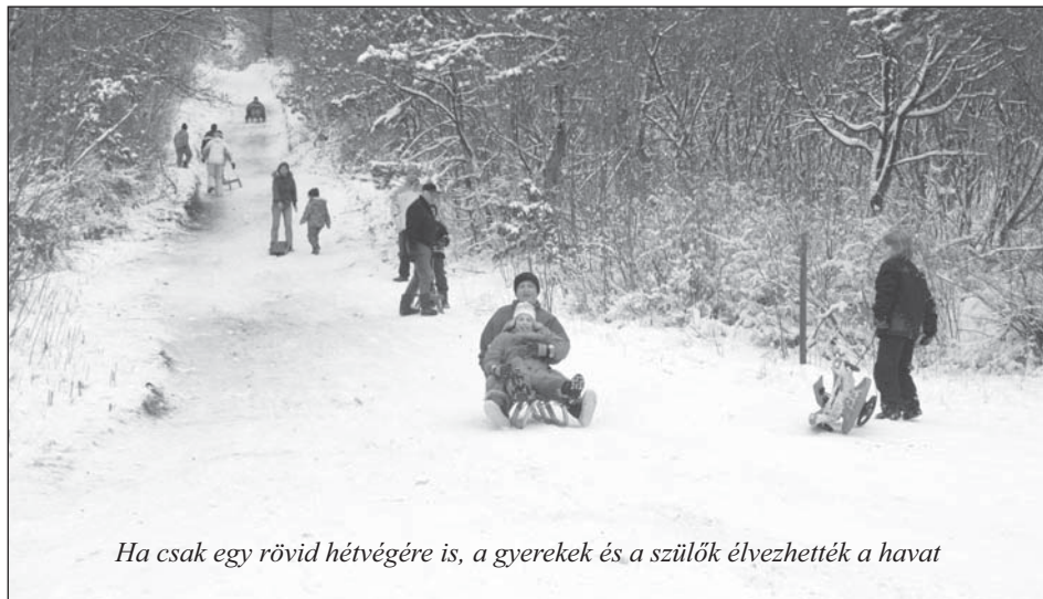
Ha csak egy rövid hétvégére is, a gyerekek és a szülők élvezhették a havat

- Önkormányzatunk nagy figyelmet fordít a környezetvédelemre és a civil szervezetekkel való együttműködésre – folytatta a gondolatot Góth Imre a Környezetvédelmi Bizottság elnöke. – Nagy öröm számunkra minden egyes sikeres szereplés, ahol Gyenesdiás jó hírnevét öregbítik egyesületeink. Közös feladataink finanszírozását szolgálja a Környezetvédelmi Alap, a fenntartható fejlődés gondolataival pedig már a Zöld Óvodánkban és ÖKO iskolánkban ismerkedhetnek meg a legfiatalabbak. Az Együttműködési Modell tapasztalatait szívesen megosztjuk mindenkiel, aki egyetért az Európa Tanács Táj Díja pályázatban megfogalmazott követelményekkel.