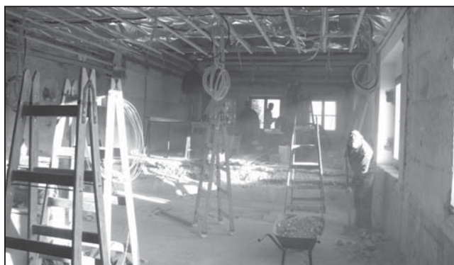
A klub és a könyvtárhelyiség még tavaly decemberben

A KÖZKINCS program 4,6 millió Ft-os támogatásával, jelentős önkormányzati saját erővel, nagyrészt önkormányzati dolgozók munkájával felújítjuk a Klubkönyvtár közel 100 éves, többször toldott-foldott épületét. Szükséges is volt, hiszen utóljára a '70-es évek elején, akkor is társadalmi összefogással