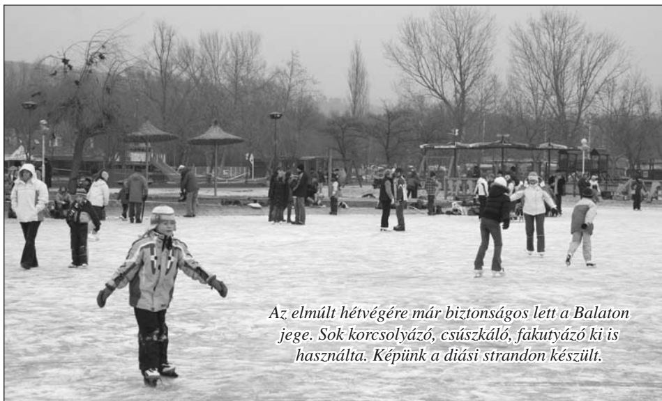
Az elmúlt hétvégére már biztonságos lett a Balaton jége. Sok korcsolyázó, csúszkáló, fakutyázó ki is használta. Képünk a diási strandon készült.